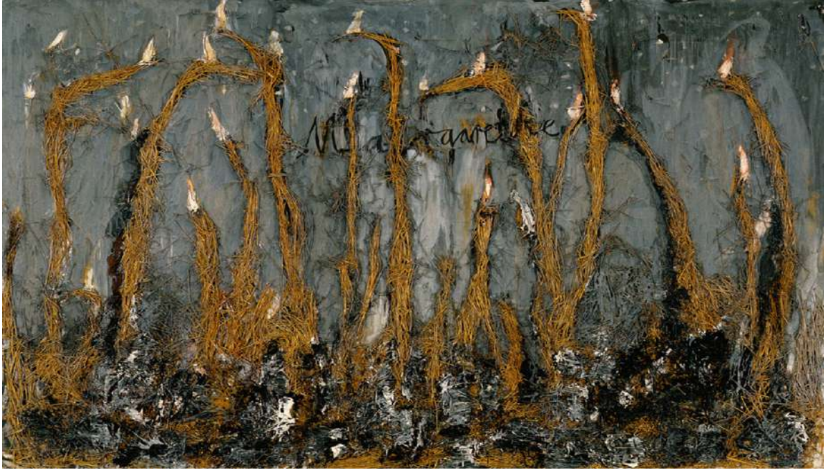
oil, grass on canvas ,۱۹۸۱ Anselm Kiefer, Margarethe

حەزى كىفەر بۇ ئەدەب و بەكارهيتانى تىكىست لە ئىشەكانىدا وەھا دەكات، كىفەر ئايدىا ئەدەبىيەكانى سىلان بۇ ھونەرى بىنراو بگوازىتەوہ بۇئەوہى لىروانەر ھانبدات ھەتاكو ترازيدىاي ھۆلۆكۆست بپەرچىنن. لە ھۆنراوہكەدا ماگەغىتۆ قزى زەردە، لە تابلۆكەدا بەرپى پووشەوہ سىمبولىزەكراوہ، كە پووش بووہ بە میدىۆمىكى دووبارە لە ئىشەكانى دىكەى كىفەردا، بەلام لىرەدا بۇ يەكەم جارە بەكاردىت. پووش بەھۆى توانستى سەوزبوونەوہ و وشكبوونەوہوہ، كىفەر وەك سىمبولى سوورپى ژيان، پەتەتى (پاكرىتى) نەژادىي (race) و خۆشەويستىي ئەلمانىي بۇ خاك بەكاردەھىننىت. ھەرەھا پووش دەگەرپتەوہ بۇ ئەفسانەى ئەلمانى «رەمپلستىلسكن» كە پووشى كرددوہ بە زىر. كىفەر ناوى ماگەغىتۆى بە رەنگى رەش لەسەر كانقاسەكە نووسىوہ و ھەندى ناوچەى تابلۆكەشى رەشكردوہ وەك ئاماژەيەك بۇ ھەبوونى بىدەنگى لەبارەى شولەمايتى سامى و ھەرەھا زۇر بەگشتىي ئاماژەيە بۇ ژمارەيەكى زۇر قزى رەش لە ئاوشقىتس (Biro, ۲۰۰۳).