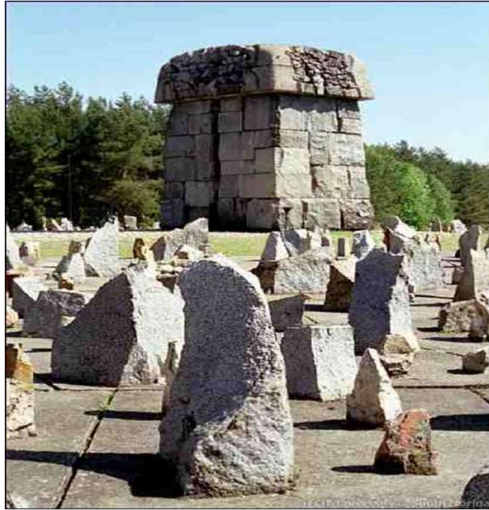
:Treblinka. Center monument side view.