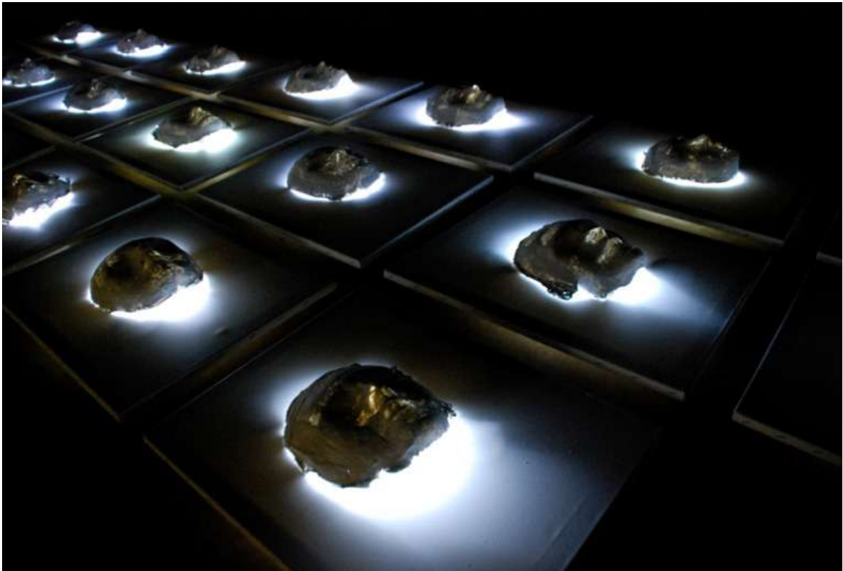
۲۰, ۳۰ cmx۴۰ cm, Chocolate Factory, London, Mixed media, ۲۰۰۸, ۲۰th Anniversary Rebwar Rashed, Anfal units, Photograph by Rebwar Rashed

هەيە و لە خۆيدا ئەم تراژيديايە بەرجەستەدەكات. بەھاي كەرەستە لە نيو رەھەندە ميژوويى، كۆمەلايەتيى و سياسيه كانيديايە (Rashed, Rebwar, ۲۰۱۲, ۶۴, ۶۹).