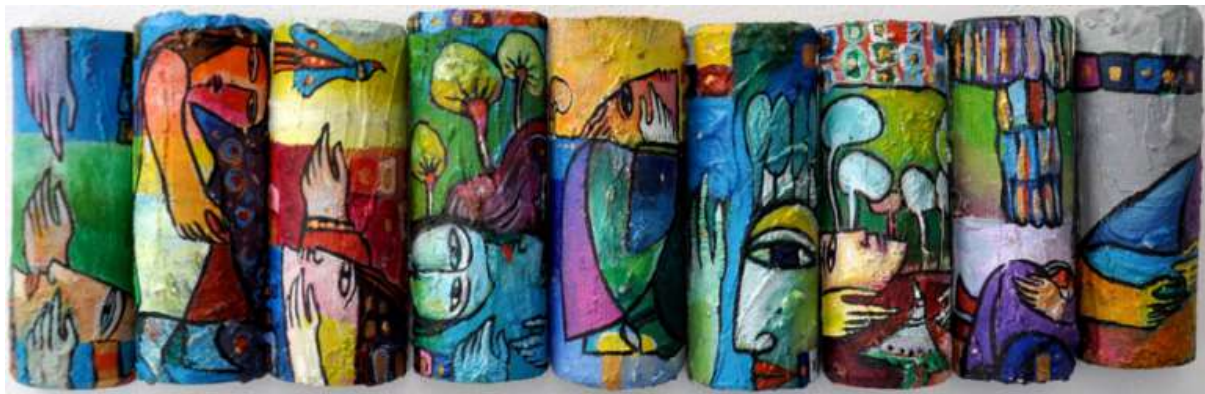
31, 12cm, Acrylic on wood, 2010, Rebwar Rashed, Month of May Diary (detail), Kawasaki City Museum units

و پاشاکان، بهلام ریوار جیاواز له م ترادیسیۆنه رووخساری قوربانیانی جینۆساید و یادهوهرییهکانیان پیشاندهدات (Rashed, Rebwar, 2012). رووخساری ناو تابلۆکانی ریوار مردووین و تهماشامان دهکهن، ههر بۆیه لهبری ئهوهی بمانخه نه گریان، ئارامیمان پیده بهخشن. تهماشاکردنی رووخسارهکان ژیاتمان له لا خوشه و پست دهکهن، نهک ته نیا مه رگمان بیر بهینهوه (سیوه یلی، 2020: 230-231).