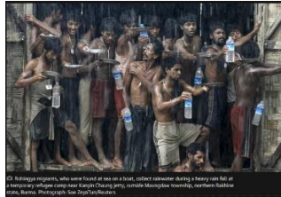
13 Rohingya migrants, who were found at sea on a boat, collect rainwater during a heavy rain fall at a temporary shelter camp near a port in Yangon, Myanmar, while Myanmar remains, northern border with Bangladesh.