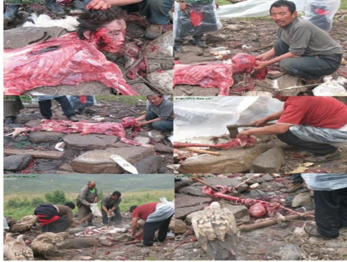
Asolanın ruh olduğuna, cesedin hiçbir değerinin kalmadığına inanan Tibet'li Budistler, ölenin etinin değerlendirilmesi için yabancı kuşlara bağışlarlar. Ceset kolay yenilebilmesi için parçalanır ve genellikle akbabalara yem edilir. Ruhların göğe yükseldiğine ve akbabaların ruhları gökteki yerlerine ulaştığına inanılır.

سكاكين، طيور جارحة، تتربق وجبتها، في الصورة السفلية هنالك عصي لف اللحم حوله بطريقة متقنة . السؤال الذي ينبغي طرحه مسبقا عند مشاهدة الصورة، ما الذي يقومون بفعله هؤلاء الرجال؟ هل هو لغرض تقطيع وتعذيب رجل ميت؟ يفترض من يفعل ذلك يكون معبأ حقدا وكرهية وغضب، بينما لا يبدو ذلك على محياهم فهم يقومون بعمل يبدو عاديا بالنسبة لهم وقد اعتادوا عليه وعند التمعن في عناصر الصورة، يتبين ان الغاية هي تقطيع الجثة لهدف ما، وليس تقطيعها عبثا، فهم يقومون بعملهم بارتياح و بلا انفعالات واضحة، مما يرجح فرضية ان الشخص ليس هو الهدف وانما امر اخر، خاصة لف اللحم حول العصي.