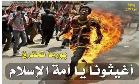
هذا الشخص في الحقيقة من التبت منفي في الهند هو من أشعل النار بنفسه.(22)

انتشرت على مواقع التواصل الاجتماعي والمدونات صور وافلام فيديو تناولت اضطهاد المسلمين في بورما، وصاحبت