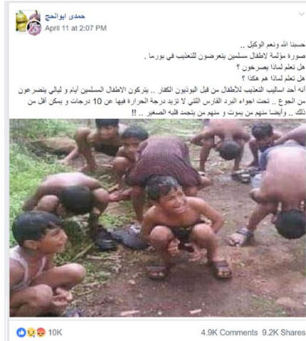
حقيقة مضمون الصورة تعبر عن احدى طرق عقاب الأطفال في الهند(9)

تداولت مواقع التواصل الاجتماعي تويتر وفيسبوك هذه الصور وصور على نفس الشاكلة على انها لمسلمي الروهينغا تم حرقهم