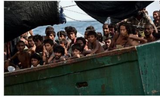
12 Rohingya migrants sit on a boat drifting in Thai waters off the island of Koh Lipe in the Andaman sea. The Burmese government's slow-acted formula for dealing with the problem from history is both inhumane and vicious. It is a recipe for the kind of tragedy we are just witnessing on the high seas.

ان الصور المزيفة لا تحمي المعاناة القاسية والاضطهاد المستمر لأقلية الروهينغا في بورما، هناك الملفات من الصور المؤلمة الحقيقية وهي كافية للتعبير عن الوضع الإنساني هناك. الصور الحقيقية لمعاناة لأقلية الروهينغا في بورما: نقلت العديد من وسائل الإعلام صور حقيقية عبرت عن مأساة الروهينغا وهي تجسد معاناة واضطهاد هذه الأقلية ان