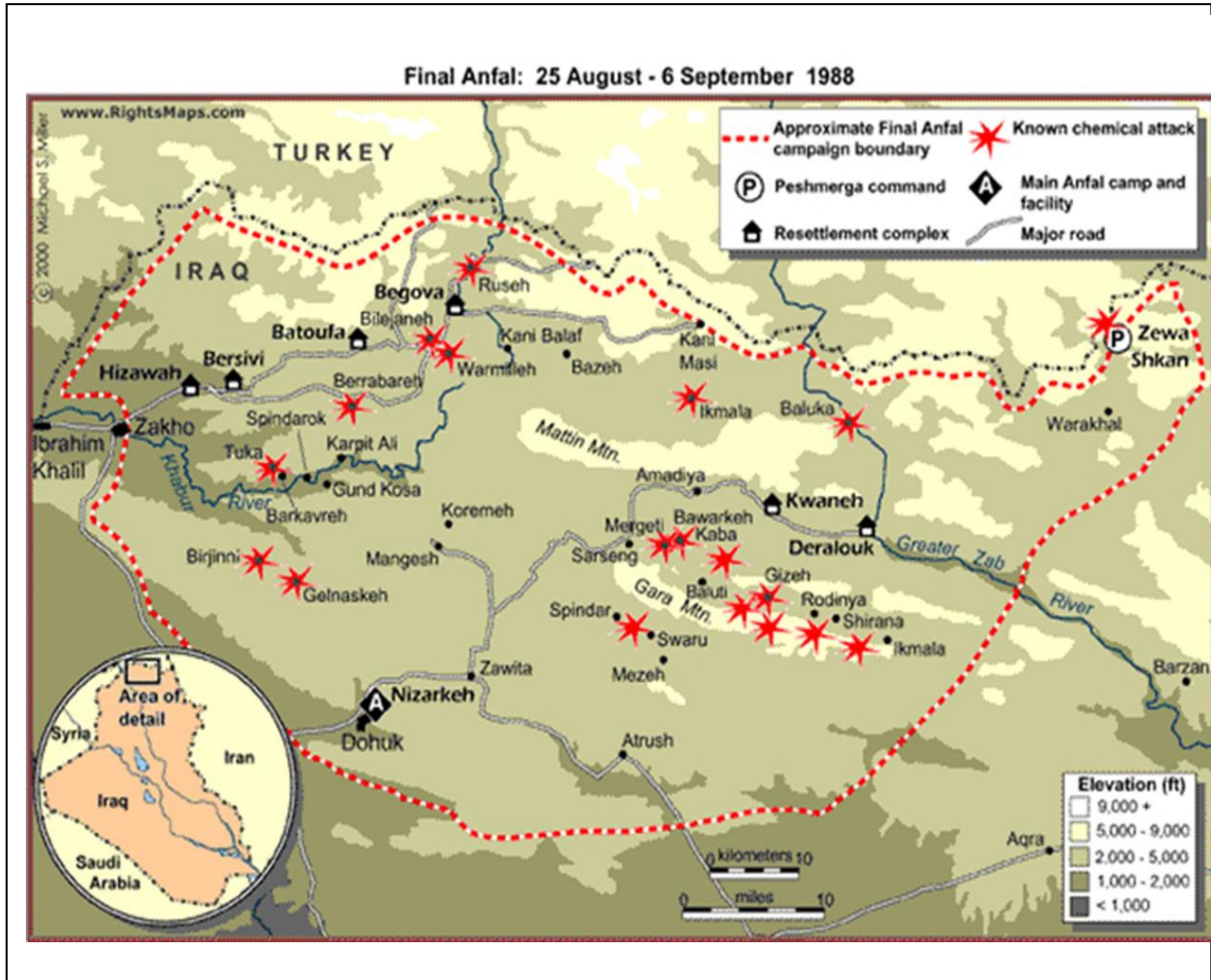
HRW/ME. Iraq's crime of Genocide. The Anfal Campaign against the (نہخشی ۲: جوگرافیا ئہ نفاللا ہہشتان. Kurds. Yale University press, New Haven and London, 1995. ل. ۱۷۶).

گوفارا زانکویا دهوک، پدربهندا: 22، ژماره: 1، (زانستین مروفاہتی و کومہ لئاسی)، بپ 214-229، 2019 (ژماره کا تایہت)، سہنتہریٰ فہ کولینین جینوسایدی، زانکویا دهوک